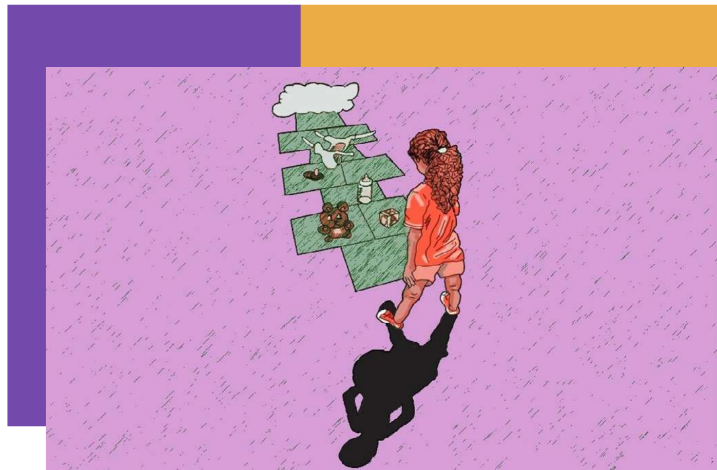
Imagem elaborada para matéria do portal Catarinas pela ilustradora Emília Santos

Esse caso abriu os olhos da sociedade para seu dever de proteção. Não é possível abordar a questão da gravidez infantil -- que na estratégia do atual governo se reduz a um problema de “gravidez precoce” -- sem tecer a correlação com o estupro de vulnerável. Este desperta a atenção para o abandono escolar e a falta de perspectiva de vida que se colocam nessas situações. A questão do estupro de vulnerável traz a necessidade do debate sobre as abordagens com que os sistemas de assistência social, saúde, segurança e justiça lidam com o problema. E torna urgente atentar para a questão educacional, onde nos deparamos com resistências históricas diante de projetos para uma educação sobre sexualidade responsável nas escolas.